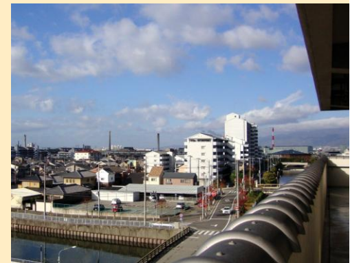
▲ベランダからの眺望